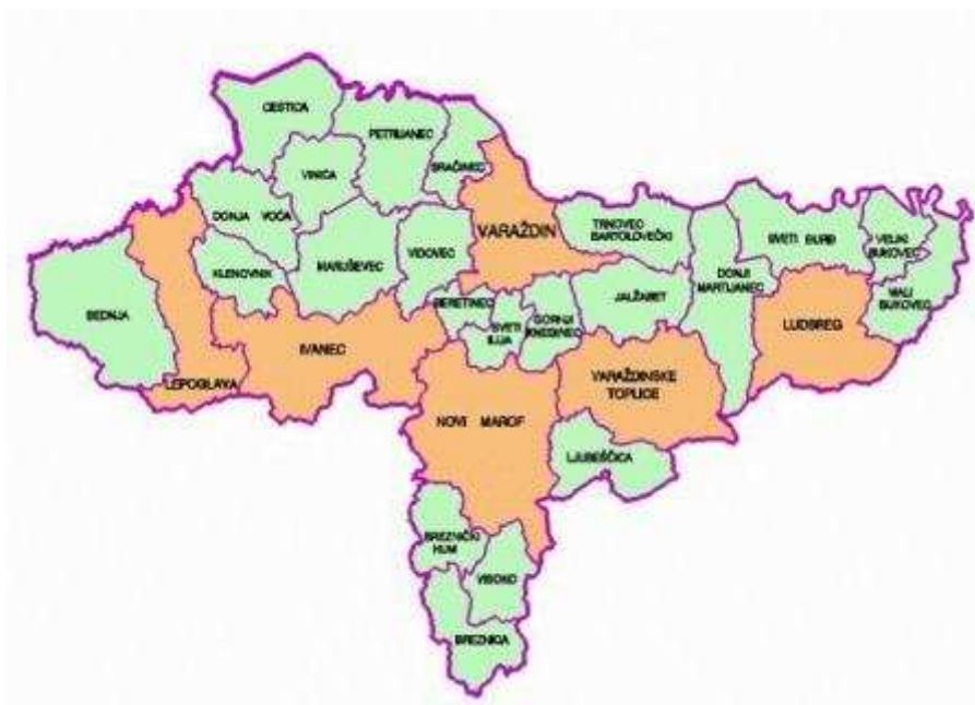
Slika 1. Smještaj Općine Breznica u Varaždinskoj županiji

Općina Breznica nalazi se u sastavu Varaždinske županije na njenom južnom dijelu. Jedna je od 22 općine i 6 gradova. Na sjeveru graniči s općinama Breznički Hum i općinom Visoko, a južno i zapadno sa Zagrebačkom županijom i istočno s Koprivničko – križevačkom županijom (Slika 1). Općina se prostire na 33 km 2 . Prema popisu stanovništva iz 2011. godine Općina Breznica ima 2.200 stanovnika, iz čega proizlazi da je gustoća naseljenosti 66,6 stanovnika/km 2 .