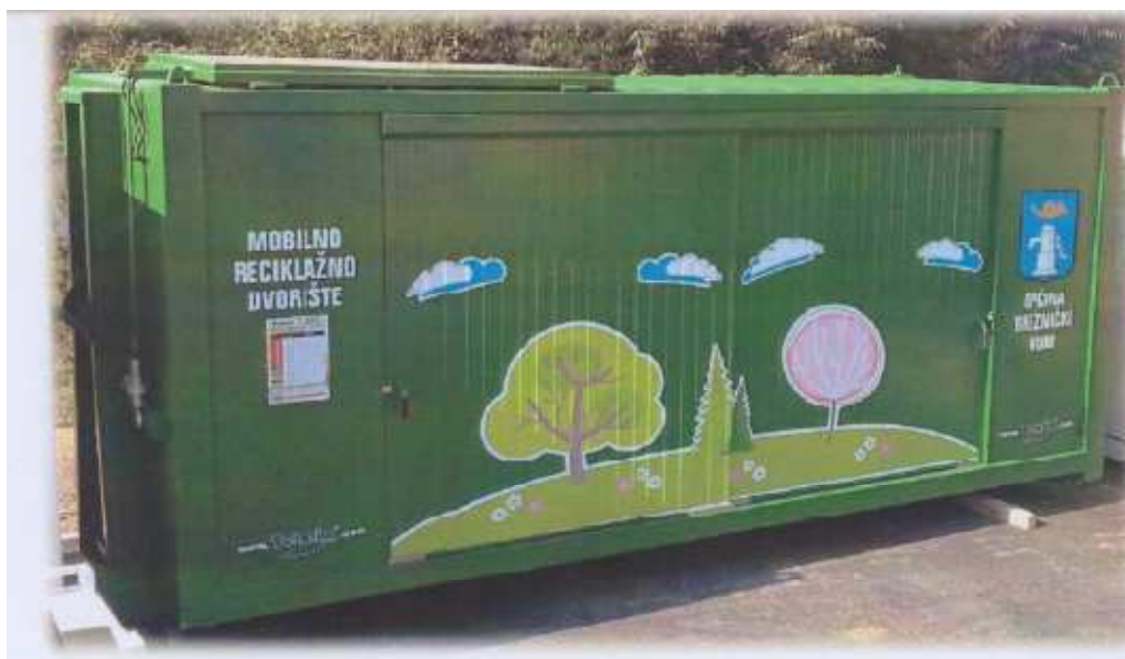
Slika 2. Mobilno reciklažno dvorište

Po izgradnji reciklažnog dvorišta te ishodajenja uporabne dozvole za isto, učestalost odvoza mobilnim reciklažnim dvorištem mijenja se na jednom svaka četiri mjeseca.