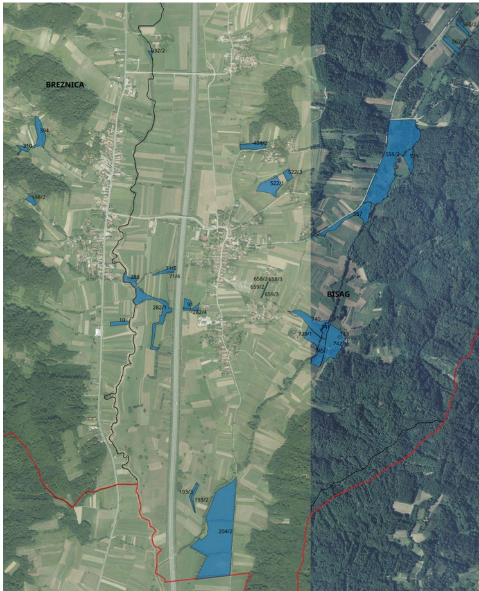
Slika 2. Poljoprivredno zemljište obuhvaćeno Programom, Izvor: Državna geodetska uprava