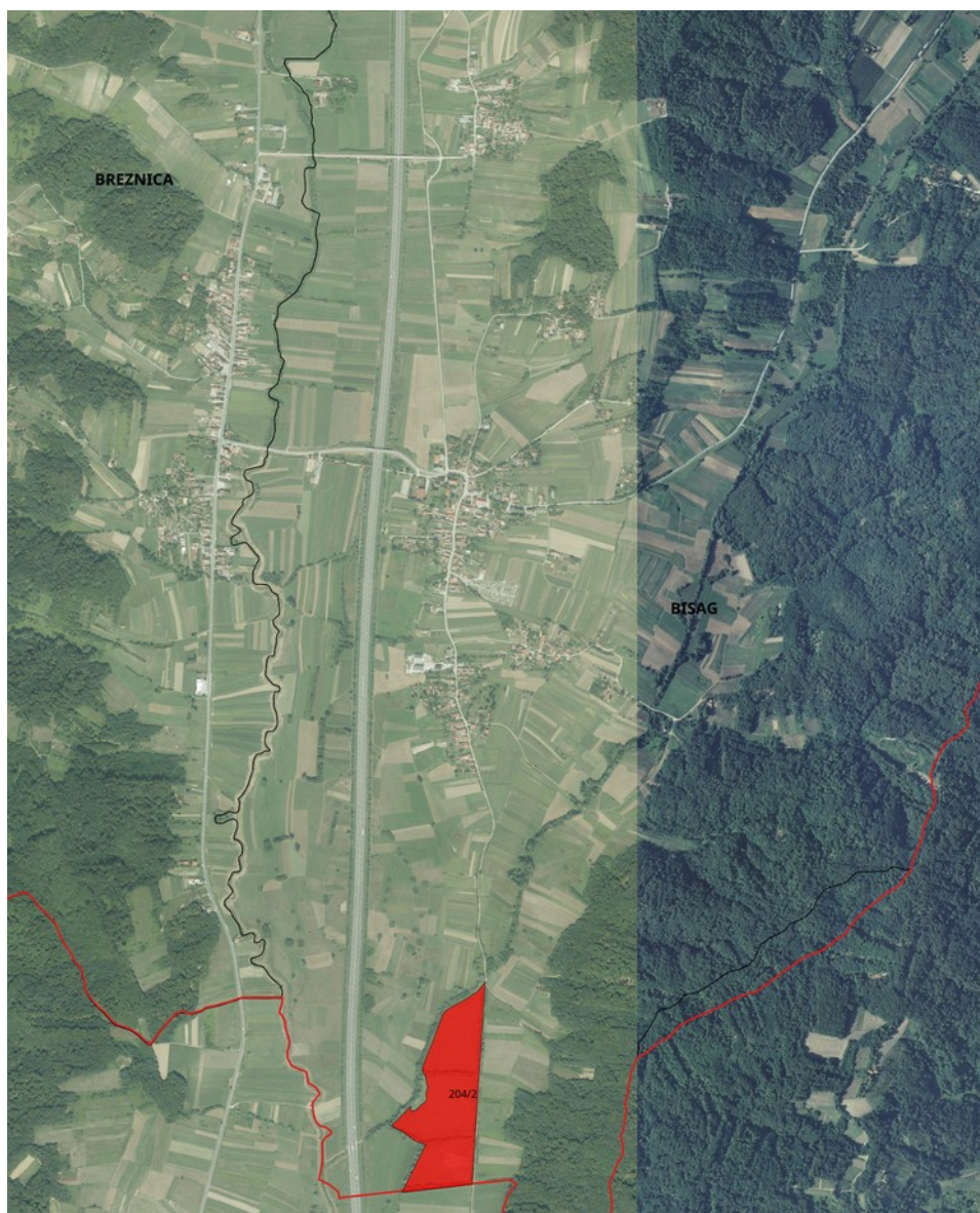
Slika 3. Poljoprivredno zemljište određeno za davanje u zakup